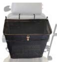
Kurv med lokk for seterygg nakkestøtte