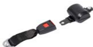
Hoftebelte Rullebelte midje