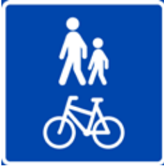
Gang- og sykkelvei