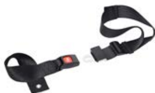
Hoftebelte 2-punkt, fast