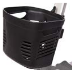
Kurv foran Inkl. feste, S19V