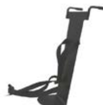
Holder for oksygentank