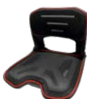
Sete mesh S19V