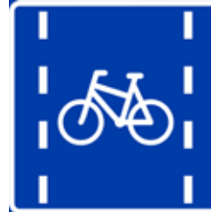
Sykkelfelt på vei