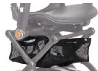
Varenett under sete S19V